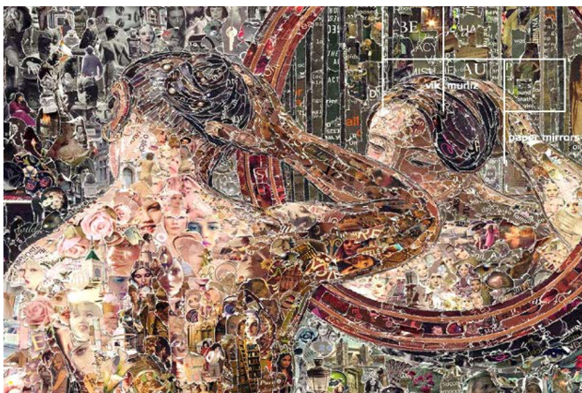
A individual de Vik Muniz recria quadros clássicos com sua técnica: assombro

A mostra traz dez produções da nova safra da cinematografia francesa, com ênfase no universo jovem europeu. Abrindo o ciclo está a animação O Quadro , de Jean-François Laguionie, mas há espaço para comédias como O Verão de Giacomo , de Alessandro Comodin, que venceu o Festival de Locarno. Entre os filmes já exibidos em circuito está O Espinho no Coração , de Michel Gondry. As exibições acontecem sempre às quartas-feiras e a programação completa está em sesisp.org.br/cultura . De 3/4 a 5/6, qua.20h30. Espaço Mezanino do Centro Cultural FIESP – Ruth Cardoso: Av. Paulista, 1.313, Cerqueira César, tel. 3146-7406 e 3146-7405. Grátis.