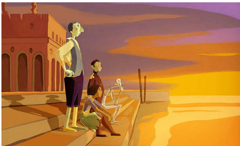
Animação O Quadro , de Jean-François Laguionie, que integra o ciclo do novo cinema francês