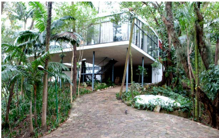
A Casa de Vidro, projeto de Lina Bo Bardi, ganha peças criadas especialmente para o espaço em The Insides are on the Outside