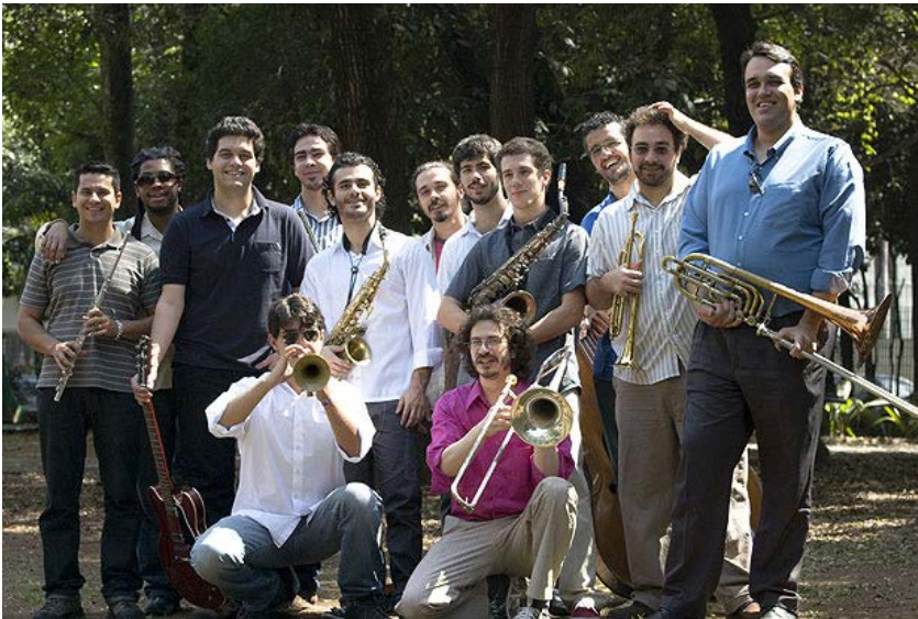
A banda Projeto Coisa Fina, que integra o Movimento Elefantes, só de big bands paulistanas

Completa no site mam.org.br . Dia 6/3, sáb. 17h, Festa Sencity. Museu de Arte Moderna de São Paulo (MAM), Parque do Ibirapuera: Av. Pedro Álvares Cabral, s/nº – Portão 3, tel. 5085-1300. Grátis.