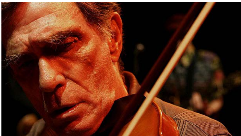
O cantor e compositor Jorge Mautner apresenta as músicas do novo trabalho, em show com Gilberto Gil

Dia 4/4, qui. 13h. Slowalk: Parque do Ibirapuera: Av. Pedro Álvares Cabral, s/n, Portão 3 (em frente ao MAM), tel. 5085-1300.